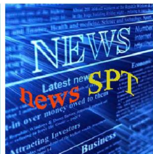
Новости как базовы...