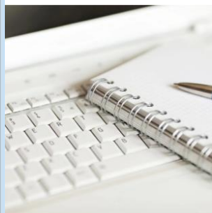
Что такое журналистика