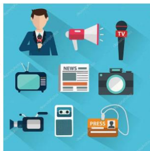
Человек в мире...