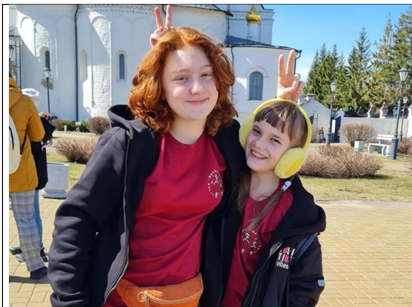
Наставник и наставляемый в путешествии в г.Казань