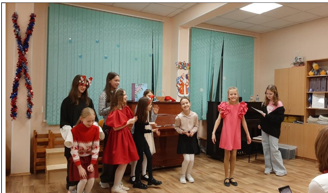
Совместный номер старших и младший ребят на Новомоднем празднике

3.Преемственность коллектива прослеживается и в репертуарной политике. У нашего коллектива есть гимн – произведение, написанное специально для нашего коллектива композитором Антониной Ростовской, которое так и называется «Весёлые голоса». Это произведение является важной частью культуры и традиций нашего коллектива.