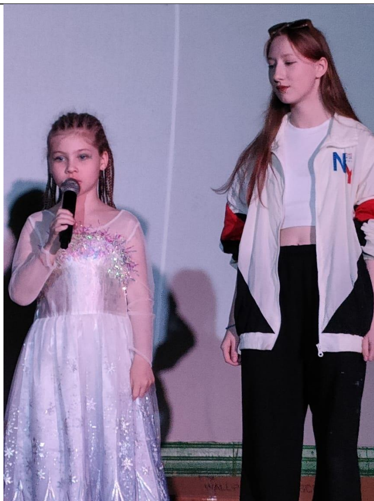
Совместный концертный номер в ДОЛ «Ракета»