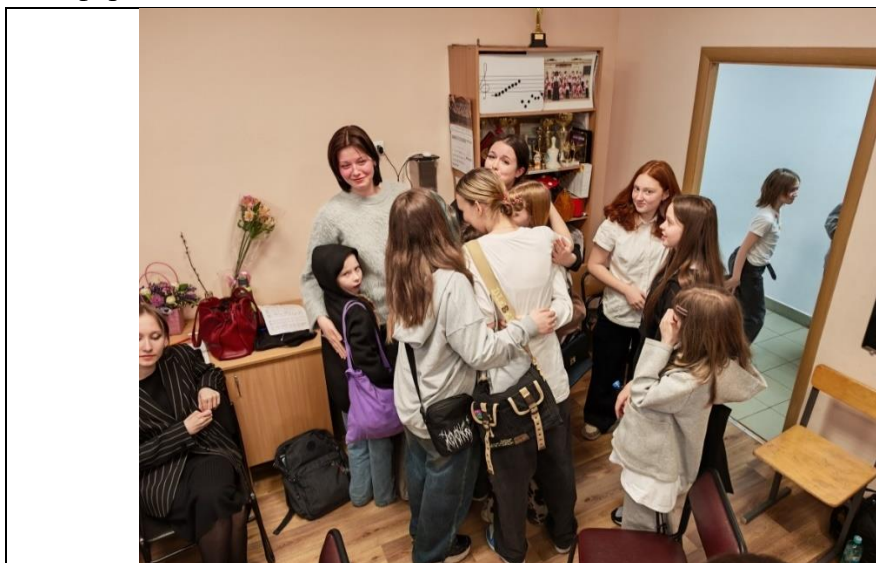
Со студентами музыкально – педагогического училища

Наши старшие ребята ежегодно участвуют в детском хоре Всероссийской летней школы хормейстеров, концертмейстеров и композиторов. Ребята общаются с представителями других хоровых коллективов из разных городов, вместе репетируют, ставят концертные номера. Этот неоценимый опыт старшие затем во время учебного года на репетициях передают младшим. Ребята нашего коллектива часто принимают участие в различных мастер-классах в рамках конкурсов и выездов в другие города. Этот опыт также передаётся вновь поступившим в живом общении на репетициях. Наш хор активно сотрудничает с Музыкально-педагогическим училищем. Ежегодно ребята-студенты приходят к нам на практику и готовят концертные номера для фестиваля на базе училища. Нашим учащимся очень интересно побывать в стенах этого учебного заведения, познакомиться со студенческой жизнью, выступить в замечательном акустическом зале училища. Помимо этого, ребята-студенты рассказывают о своей учёбе, будущей профессии, в неформальной обстановке делятся опытом.